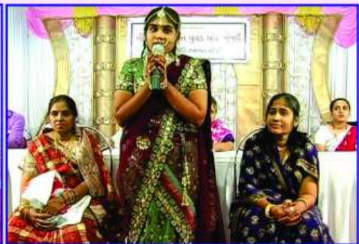
દીક્ષાર્થી બહેન દ્વારા સંબોધન