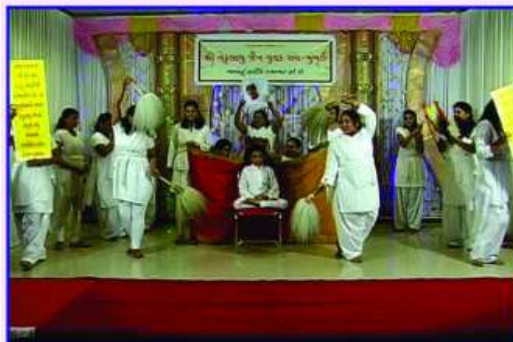
પૂ.સા. હંસાવલીશ્રીજી મ.સા.ના ચાતુર્માસે પધારવા નૃત્યનાટિકા દ્વારા અર્પીલ