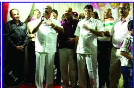
પુરાપુશાલ મુદ્રામાં તેકુલાધુ સંઘના કાર્યકર્તાઓ