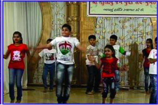
યાજ્ઞકો દ્વારા સાંસ્કૃતિક કાર્યક્રમ