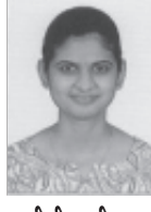
કુ.યશસ્વીની મણીલાલ ગોસર દાવણગેરી S.Y.BPT-72%