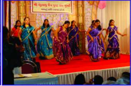
લોકનૃત્ય કરતી અહેનો