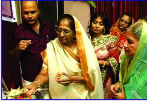
દીપ પ્રાગટ્ય કરતાં નવલબાઈ દંડ જ્યોતિ દંડ, ત્રિયા મોતા અને તોરલ દંડ