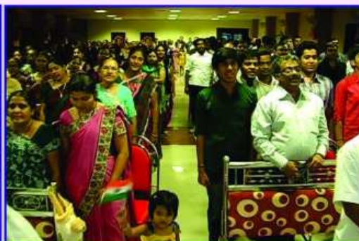
ગામવાસીઓ દ્વારા રાષ્ટ્રગીત સન્માન