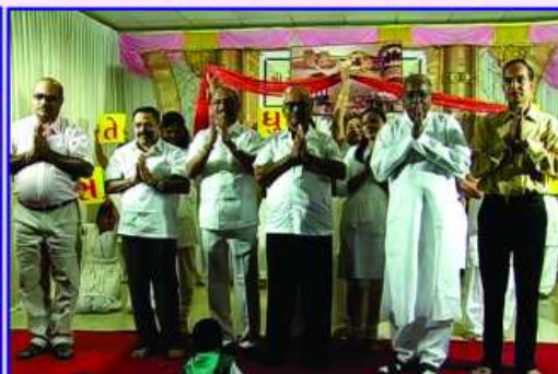
તેકુલાધુ સંઘ તરફથી ચાતુર્માસે પધારવા અર્પીલ