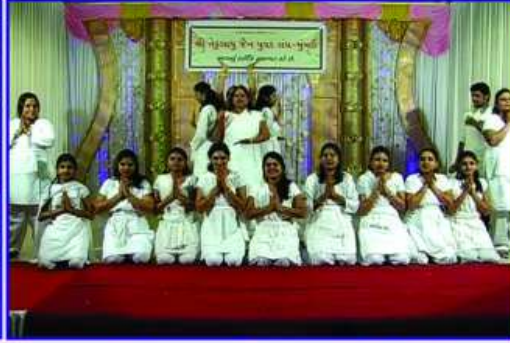
સમોવશરણની રચના કરતી અહેનો