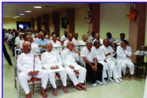
સાંસ્કૃતિક કાર્યક્રમ માણતા ગામવાસીઓ