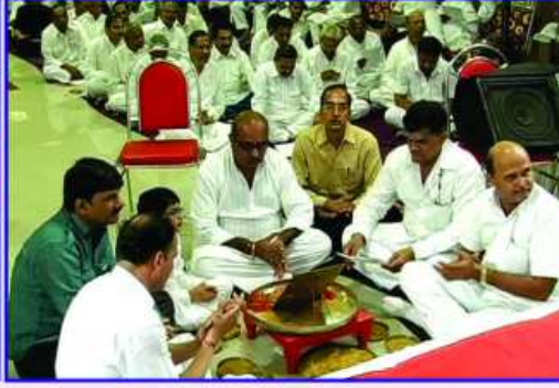
નવકાર મંત્ર જાપમાં તેકુલાધુ સંઘનાં કાર્યકર્તાઓ