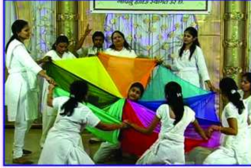
કુલોની સુગંધમાં મસ્ત આલિકાઓ