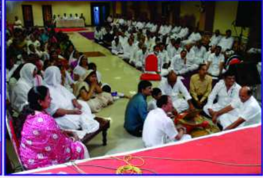
નવકાર મંત્રના જાપમાં મગ્ન શ્રોતાગણ