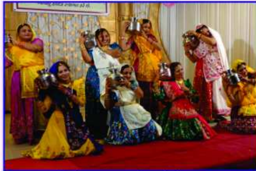
બેડાં નૃત્ય કરતી અહેનો