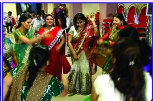
રાસગરબા રમતી અહેનો