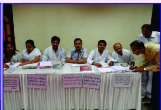
રજીસ્ટ્રેશન કાઉન્ટર સંભાળતાં કાર્યકરો